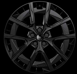
20" könnyűfém Noir mate CRISTAL keréktárcsák