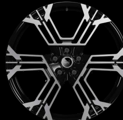
21" könnyűfém Noir brillant diamantées SNOWFLAKE keréktárcsák