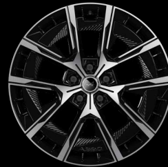
20" könnyűfém Noir brillant diamantées CRISTAL keréktárcsák