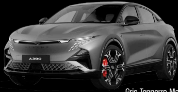
Gris Tonnerre Mat