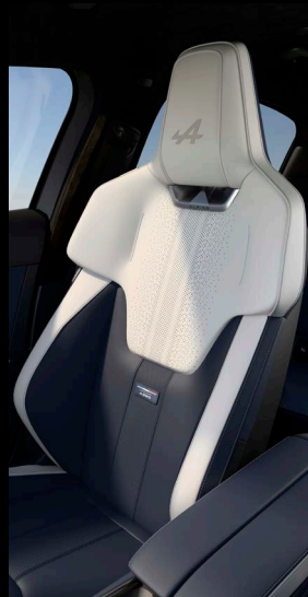
Alpine Sport ülések by Sabell® kéttónusú Nappa bőr kárpitozással