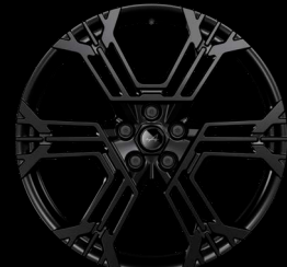
21" könnyűfém Noir mate SNOWFLAKE keréktárcsák