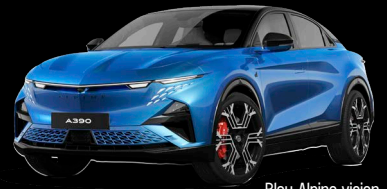
Bleu Alpine vision