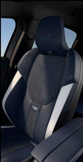
Alpine Sport ülések Alcantará betétekkel